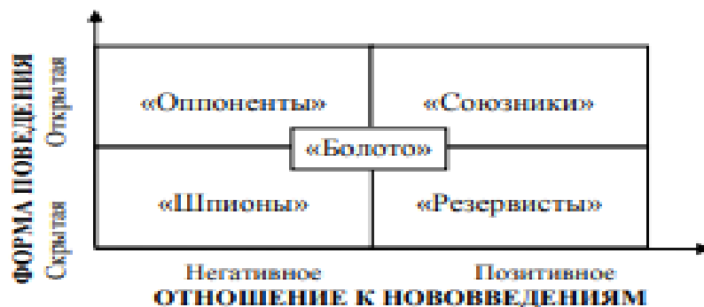
Рисунок. Типы работников организации

Задача. Какие стратегические решения должен принять руководитель организации по каждому из инновационных проектов, представленных на рисунке.